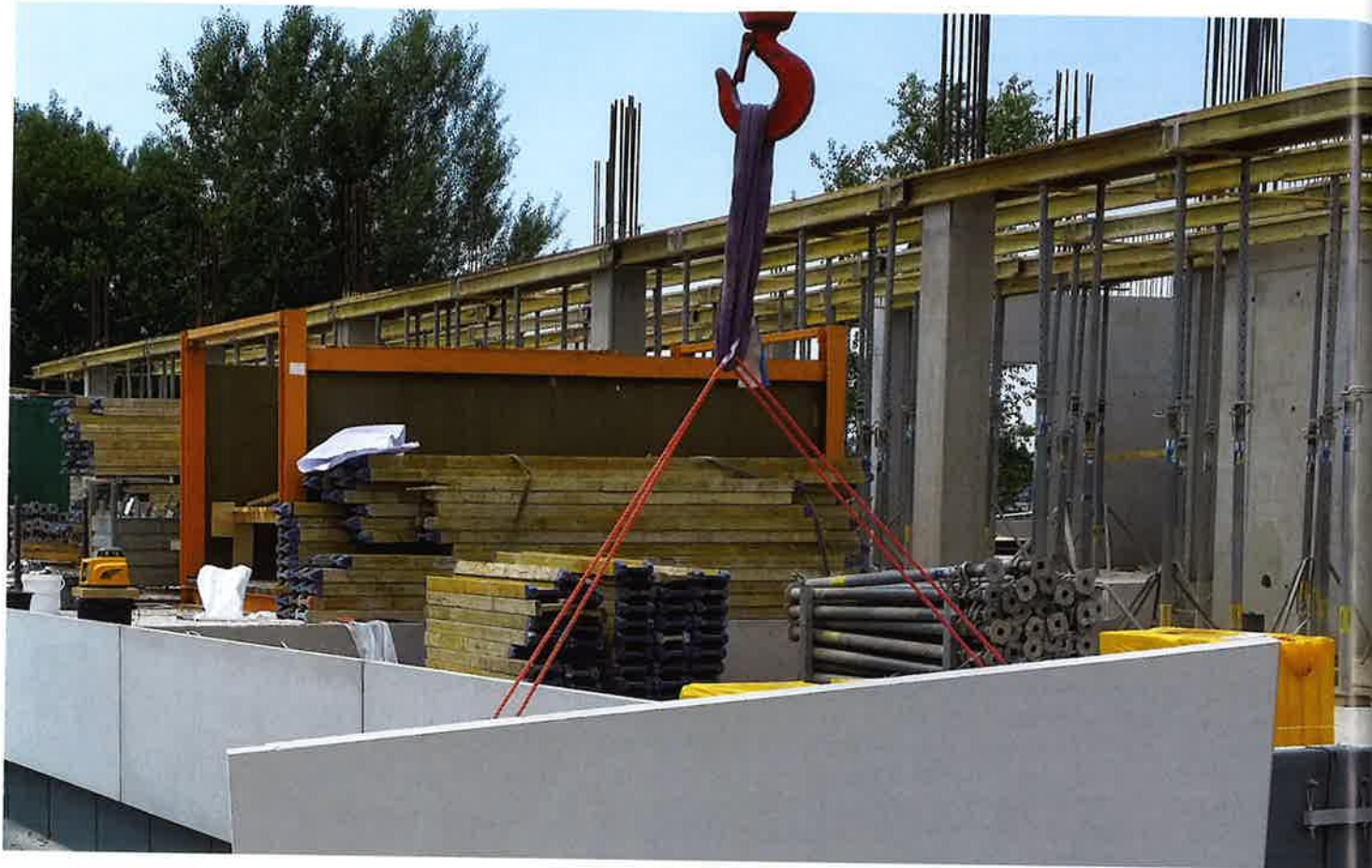
Abb. 8 (Bild links oben) Faserbewehrte Sockelplatte