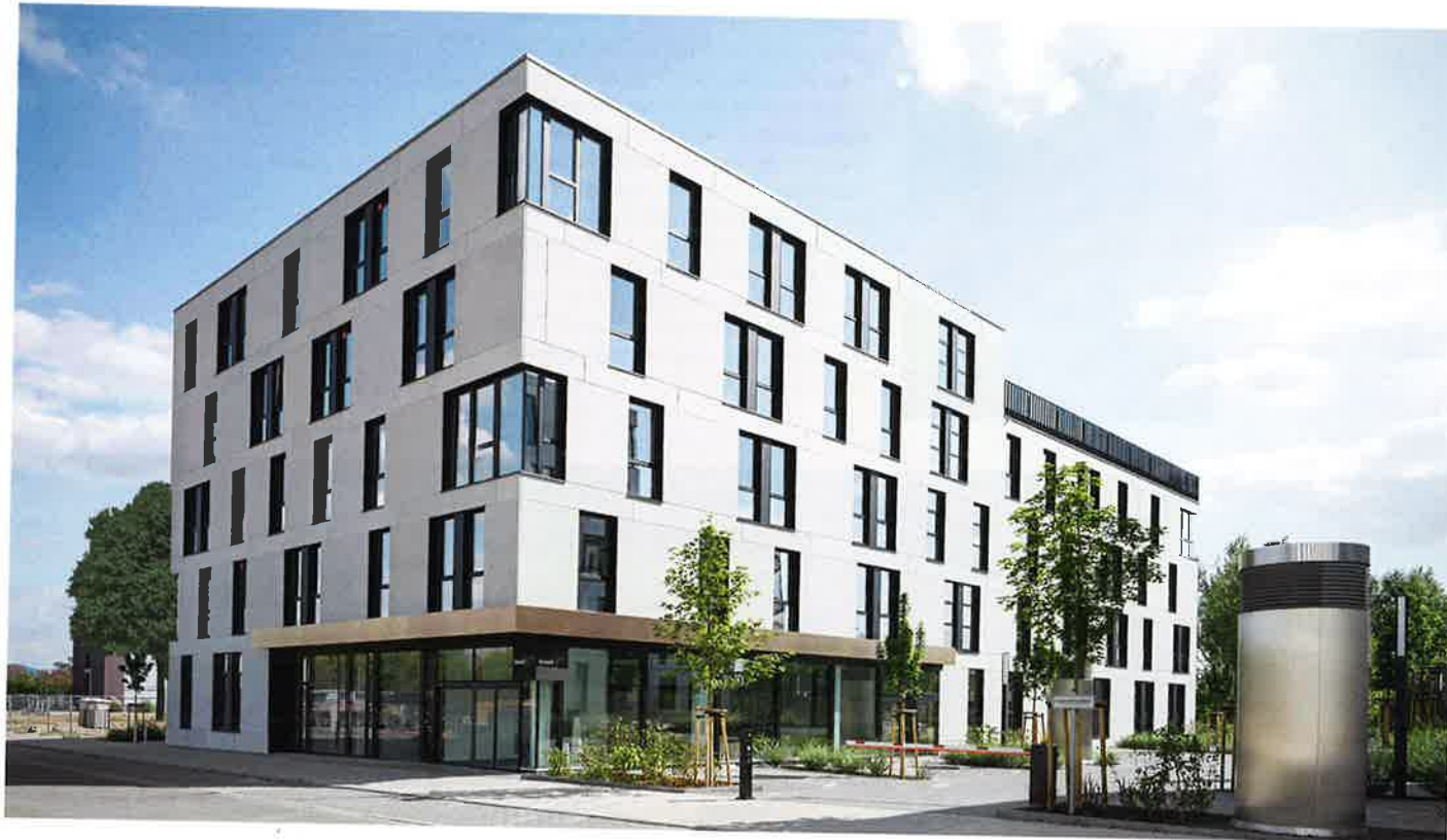
Abb. 1 (Bild oben) Eastsite XI